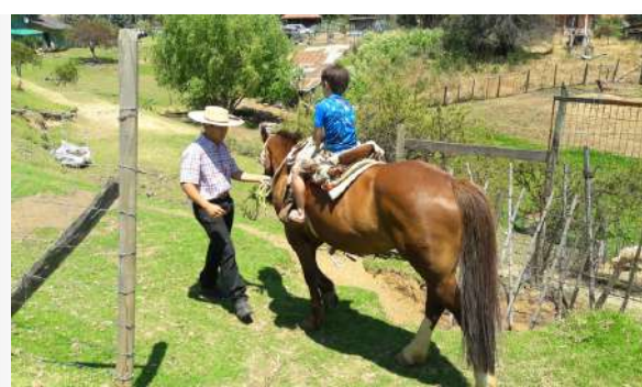
Paseo a caballo