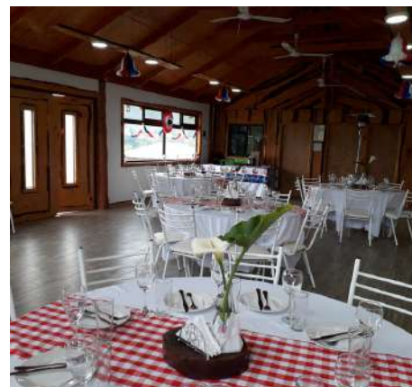
Salón de Evento

¡Te invitamos a vivir una experiencia única para tu empresa en un entorno que combina lo natural con lo moderno! Celebra los logros, la perseverancia y la unidad que han definido a tu empresa durante todo el año en nuestros espacios al aire libre. En La Carrera Mallarauco, te ofrecemos un programa especial diseñado para crear momentos inolvidables. ¡No te lo pierdas!