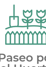
Paseo por el Huerto