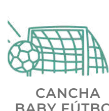
CANCHA BABY FÚTBOL